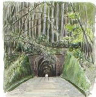
Utsunoya Pass 二ツ井峠

"Blanc comme tofu au relais du Sur-yendo! Fèves dans nos yeux! mais trop richement pourvus sous nos doigts au relais."