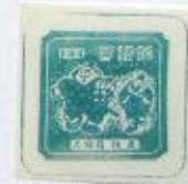
Kikuchi et Yajiroku