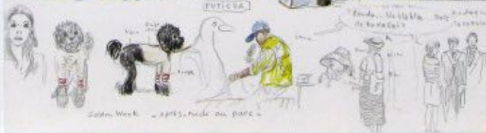
Samedi - après-midi au parc