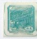
Palais Kasuga Jōkyū