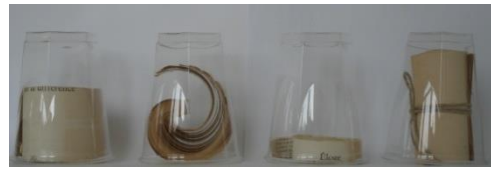
Eloge de la différence