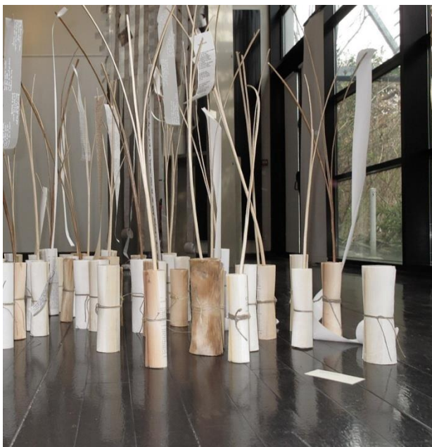
Printemps des poètes, installation au sol