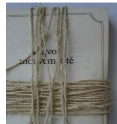
Histoire bien ficelée