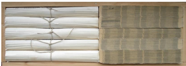
Millefeuilles et rouleaux de printemps