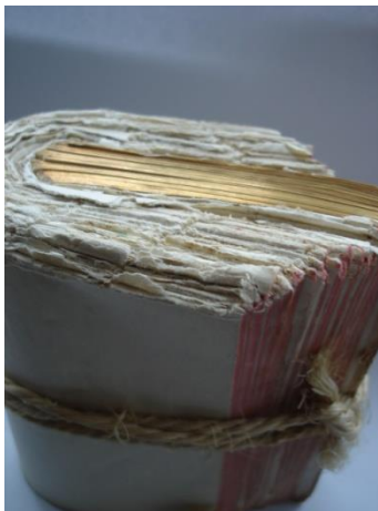
rouge et or

C'est à la fois très reposant et très drôle.