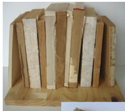
Langue de bois